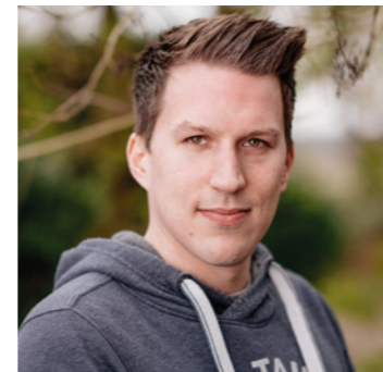
Kay Wern Auftragsmanagement

Mir macht es viel Freude den Kunden möglichst schnell zu bedienen. Ob es ein Neuauftrag ist oder auch eine Reklamation.