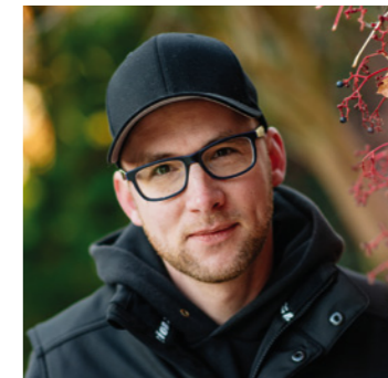
Reno Hottenbach Logistik

Für mich ist jede Baustelle eine neue Herausforderung, mein Anspruch ist die Kundenzufriedenheit, nur so kann man über sich hinaus wachsen.