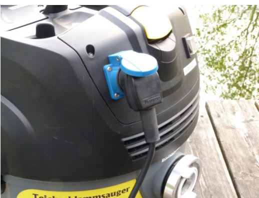
« Bild 3 Stecker der Behälter- entleerungspumpe

Schalten Sie den Sauger selbst ab wenn der Wasserstand im Behälter den oberen Bereich des Kontrollfensters erreicht hat.