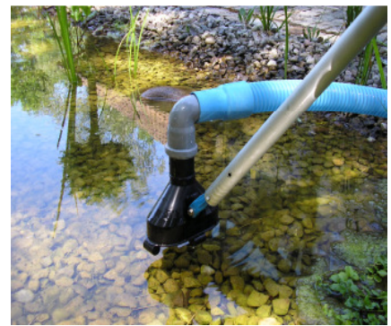
Absaugglocke (Bild 2b)

Reinigen Sie, wenn nötig, vor Arbeitsbeginn die Abschaltkontakte für den Behälterfüllstand mit einer Drahtbürste oder Schleifpapier (Bild 2). Durch die Entfernung von Schmutz und Ablagerungen ist ein störungsfreier Betrieb gewährleistet. Montieren Sie noch die gewünschte Ansaughülse evtl. mit Teleskopstange an das Schlauchende (Bild 2a+2b). Nun schließen Sie den Ablaufschlauch an den seitlichen Anschluss ( Druckseite ) an und verlegen das Schlauchende ins Gelände oder in die Kanalisation. Achten Sie darauf, dass der Saugkopf richtig auf dem Behälter sitzt. Stecken Sie den Stecker der Behälterentleerungspumpe, welcher seitlich aus dem Behälter kommt, in der Steckdose am Saugkopf ein (Bild 3).