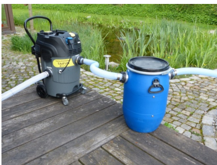
Saugen mit Vorabscheider (Bild 7)

Bei starken Verschmutzungen sollte ein Vorabscheider (erhältlich als Zubehör) verwendet werden (Bild 7)