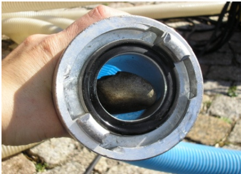
« Bild 5 Stein in der C-Kupplung des Saugschlauches