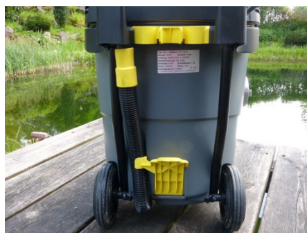
aufgesteckter Behälterentleerungsschlauch (Bild 8)