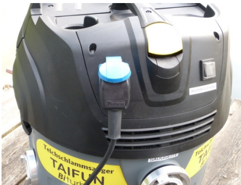
korrekt aufgestellter Taifun (Bild 1)

Stellen Sie den Sauger möglichst in gleicher Höhe des Wasserspiegels auf ebenem Grund beim Teich auf (Bild 1). Je geringer Ansaughöhe, desto besser die Saugleistung. Sichern Sie den Sauger gegen Umfallen. Befestigen Sie den Saugschwimmschlauch (blaue Schlauch) an der vorderen C-Kupplung ( Saugseite ) des Saugers.