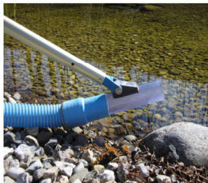
Universaldüse (Bild 2a)